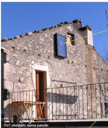
SV7 montado numa parede