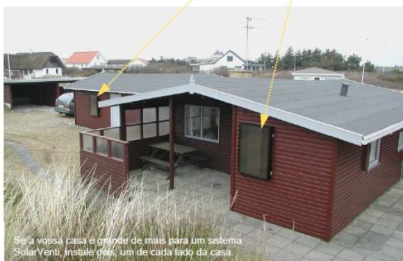
Se a vossa casa é grande de mais para um sistema SolarVenti, instale dois, um de cada lado da casa.

Centro Comercial Palmeiras Loja 132 Piso 1 - Oeiras Tel. 21 4572951 Tlm 966 084 732