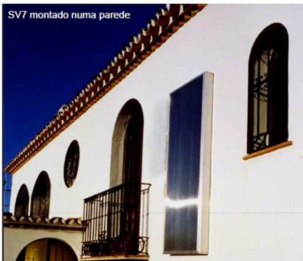
SV7 montado numa parede

A ventoinha SolarVenti tem a capacidade de 50-150 m 3 /h, o que assegura uma insuflação contínua de ar ambiente. Quaisquer humidades e cheiros são rapidamente removidos e a energia extra ajuda no aquecimento da casa.